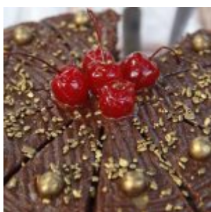
Festival Cultural Gastronômico de Olinda