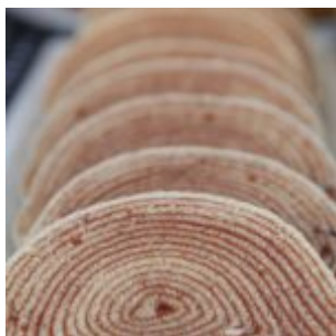
Festival Cultural Gastronômico de Olinda