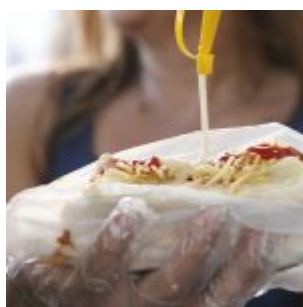
Festival Cultural Gastronômico de Olinda