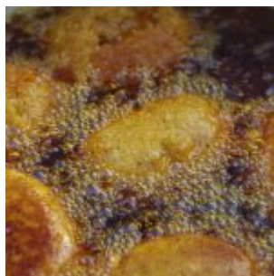
Festival Cultural Gastronômico de Olinda