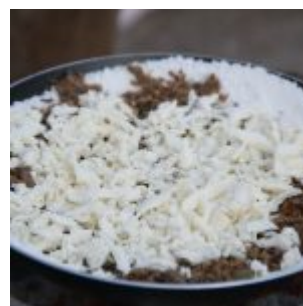
Festival Cultural Gastronômico de Olinda