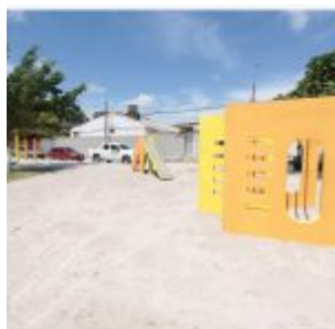
Inauguração da Academia da Saúde de Rio Doce.