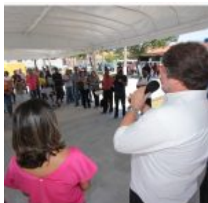
Inauguração da Academia da Saúde de Rio Doce.