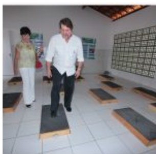
Inauguração da Academia da Saúde de Rio Doce.