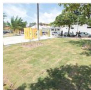
Inauguração da Academia da Saúde de Rio Doce.