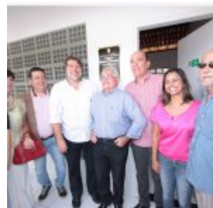
Inauguração da Academia da Saúde de Rio Doce.