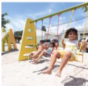
Inauguração da Academia da Saúde de Rio Doce.