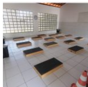
Inauguração da Academia da Saúde de Rio Doce.