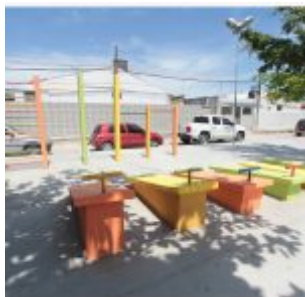
Inauguração da Academia da Saúde de Rio Doce.