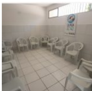
Inauguração da Academia da Saúde de Rio Doce.