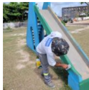
Arrumando a Praça aporta na Ilha de Santana em Jardim Atlântico