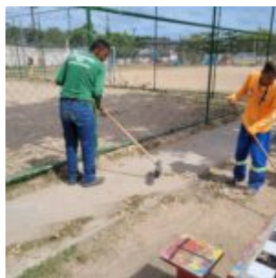
Arrumando a Praça aporta na Ilha de Santana em Jardim Atlântico