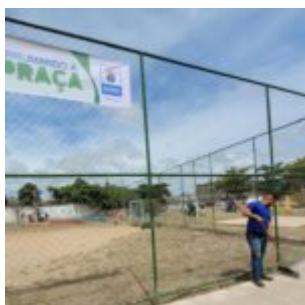
Arrumando a Praça aporta na Ilha de Santana em Jardim Atlântico