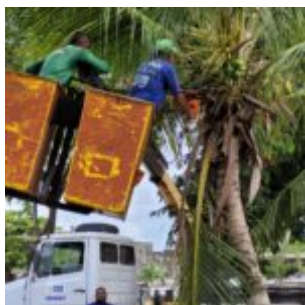
Arrumando a Praça aporta na Ilha de Santana em Jardim Atlântico