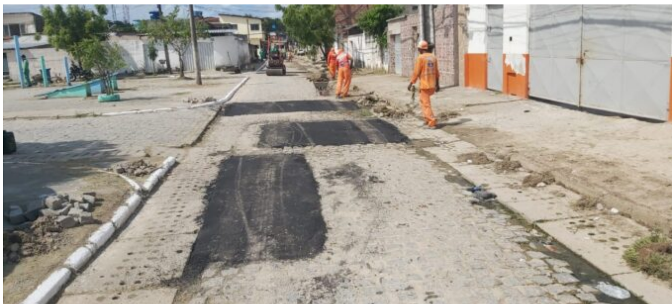
Varrição e pintura de meio-fio