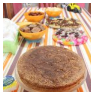
Fotos da Casa de Passagem