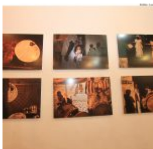
Dia Estadual do Maracatu.