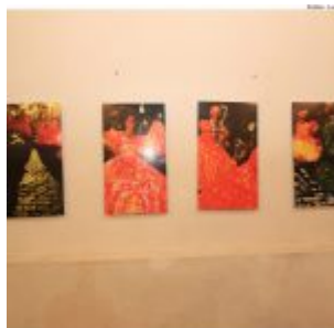
Dia Estadual do Maracatu.