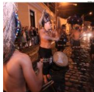
Dia Estadual do Maracatu.