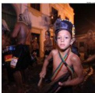
Dia Estadual do Maracatu.