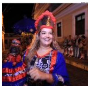
Dia Estadual do Maracatu.