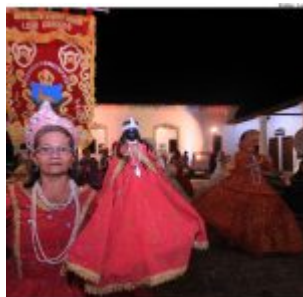
Dia Estadual do