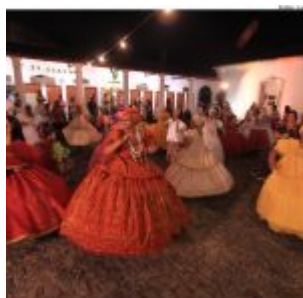
Dia Estadual do Maracatu.