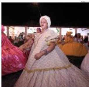
Dia Estadual do