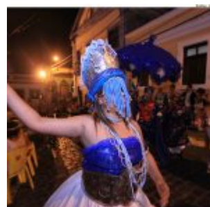
Dia Estadual do Maracatu.