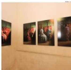
Dia Estadual do Maracatu.