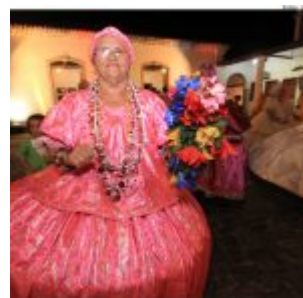
Dia Estadual do Maracatu.