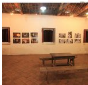
Dia Estadual do Maracatu.