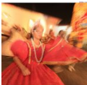
Dia Estadual do Maracatu.