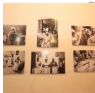
Dia Estadual do Maracatu.