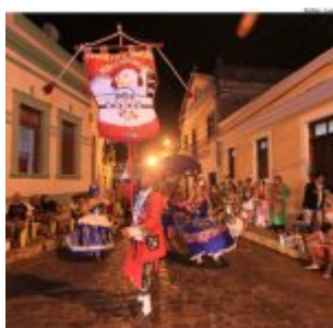
Dia Estadual do Maracatu.