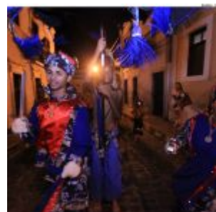
Dia Estadual do Maracatu.