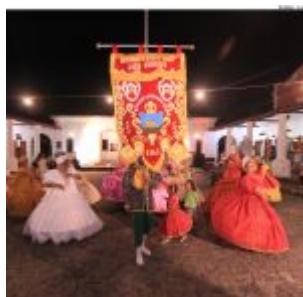
Dia Estadual do Maracatu.