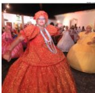
Dia Estadual do Maracatu.