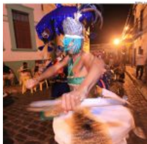
Dia Estadual do Maracatu.