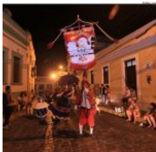
Dia Estadual do Maracatu.