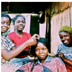
Instantâneas da África - Foto: Diego Di Niglio

proporcionar aos participantes do evento o contato com essas diferentes formas de praticar a fotografia.