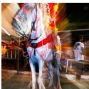
Cores em Movimento - Foto: Luca Fiorini