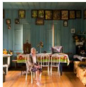
Camponesa do Paraná

Exposição Olinda Patrimônio Cotidiano