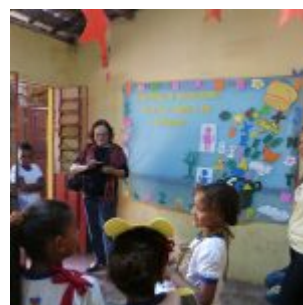
I Feira Literária da Escola Iracema Pires, em Aguazinha.