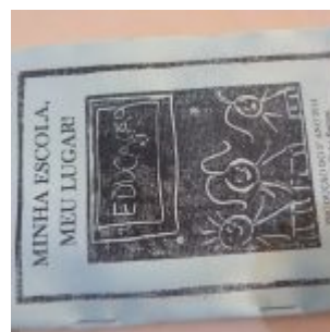
I Feira Literária da Escola Iracema Pires, em Aguazinha.