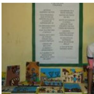
I Feira Literária da Escola Iracema Pires, em Aguazinha.