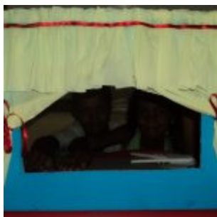
I Feira Literária da Escola Iracema Pires, em Aguazinha.