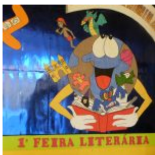
I Feira Literária da Escola Iracema Pires, em Aguazinha.