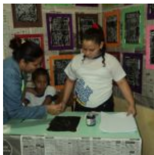
I Feira Literária da Escola Iracema Pires, em Aguazinha.