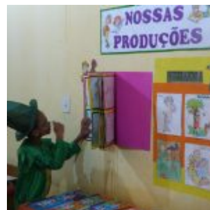
I Feira Literária da Escola Iracema Pires, em Aguazinha.