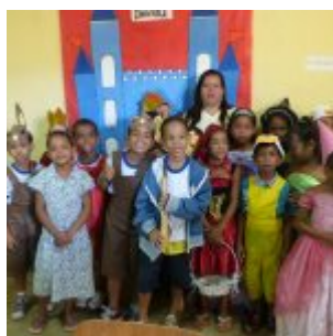
I Feira Literária da Escola Iracema Pires, em Aguazinha.