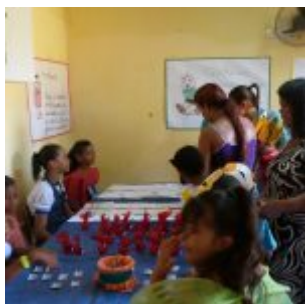
I Feira Literária da Escola Iracema Pires, em Aguazinha.