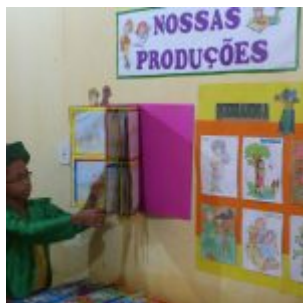
I Feira Literária da Escola Iracema Pires, em Aguazinha.