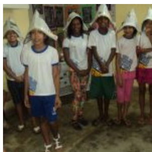
I Feira Literária da Escola Iracema Pires, em Aguazinha.