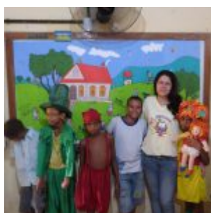
I Feira Literária da Escola Iracema