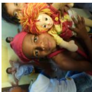
I Feira Literária da Escola Iracema Pires, em Aguazinha.