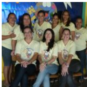
I Feira Literária da Escola Iracema Pires, em Aguazinha.