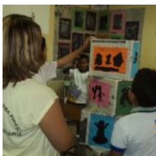
I Feira Literária da Escola Iracema Pires, em Aguazinha.