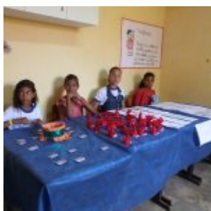
I Feira Literária da Escola Iracema Pires, em Aguazinha.