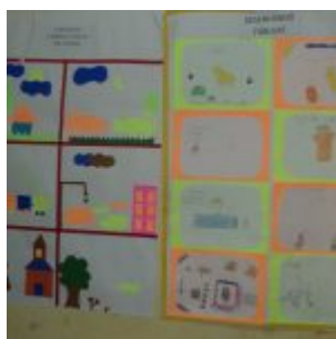
I Feira Literária da Escola Iracema Pires, em Aguazinha.