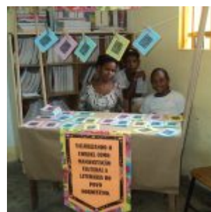
I Feira Literária da Escola Iracema