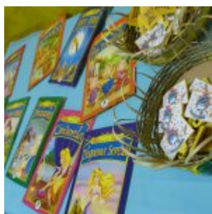
I Feira Literária da Escola Iracema Pires, em Aguazinha.