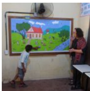
I Feira Literária da Escola Iracema Pires, em Aguazinha.