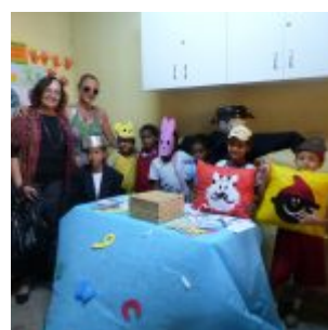
I Feira Literária da Escola Iracema Pires, em Aguazinha.