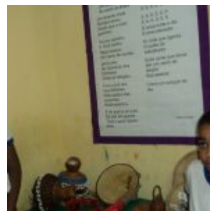
I Feira Literária da Escola Iracema Pires, em Aguazinha.