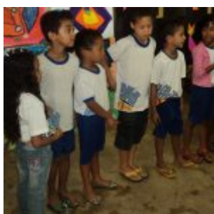
I Feira Literária da Escola Iracema