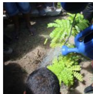
Celebração da Lei do Pau-Brasil, em Olinda.