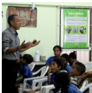
Celebração da Lei do Pau-Brasil, em Olinda.