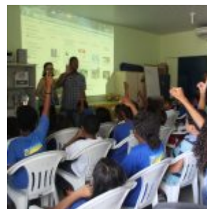
Celebração da Lei do Pau-Brasil, em Olinda.