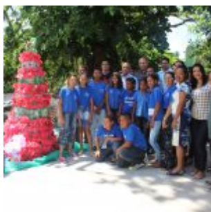
Celebração da Lei do Pau-Brasil, em Olinda.