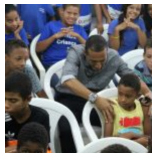
Celebração da Lei do Pau-Brasil, em Olinda.