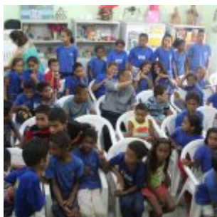
Celebração da Lei do Pau-Brasil, em Olinda.