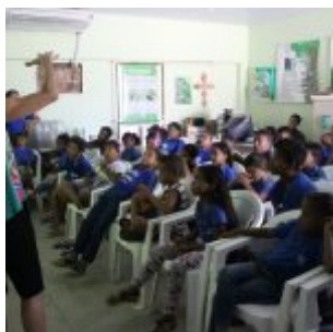
Celebração da Lei do Pau-Brasil, em Olinda.