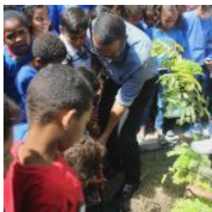
Celebração da Lei do Pau-Brasil, em Olinda.