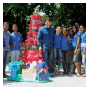
Celebração da Lei do Pau-Brasil, em Olinda.