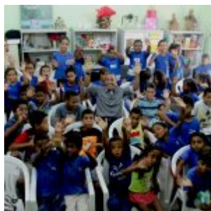
Celebração da Lei do Pau-Brasil, em Olinda.