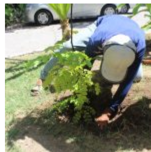
Celebração da Lei do Pau-Brasil, em Olinda.