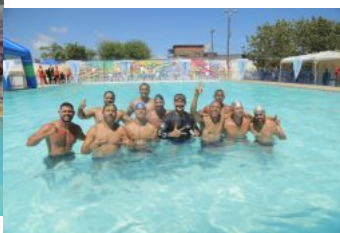
Festival de Natação da Vila Olímpica - 30.11.19