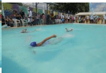
Festival de Natação da Vila Olímpica - 30.11.19