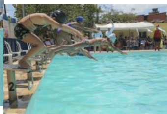
Festival de Natação da Vila Olímpica - 30.11.19