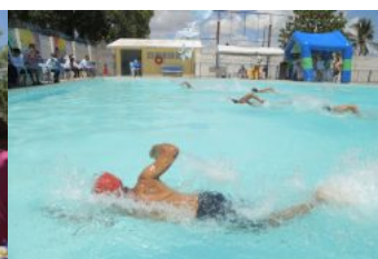
Festival de Natação da Vila Olímpica - 30.11.19