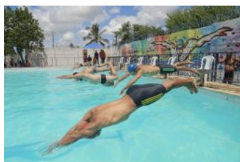
Festival de Natação da Vila Olímpica - 30.11.19