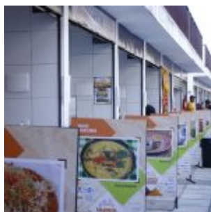
1º Festival Gastronômico Olinda Dá Gosto