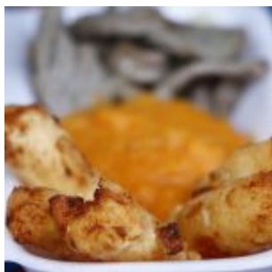
1º Festival Gastronômico Olinda Dá Gosto