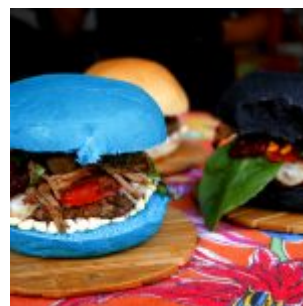
1º Festival Gastronômico Olinda Dá Gosto