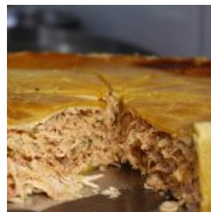
1º Festival Gastronômico Olinda Dá Gosto - Foto: Sandro Barros / PMO