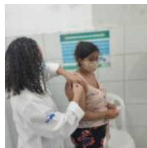
Campanha Dia D de vacinação