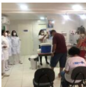
Campanha Dia D de vacinação