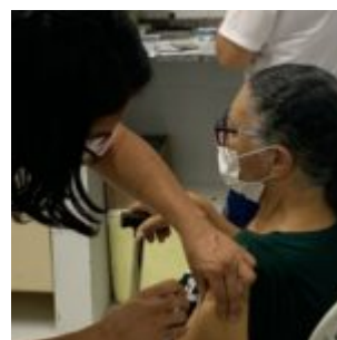
Campanha Dia D de vacinação