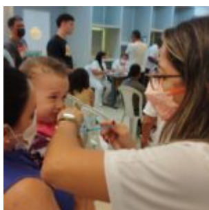
Campanha Dia D de vacinação