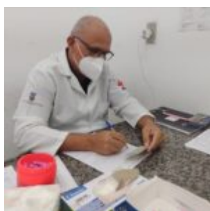
Olinda faz ações alusivas ao Dezembro Vermelho