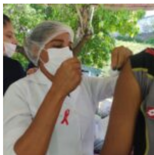
Olinda faz ações alusivas ao Dezembro Vermelho