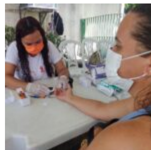
Olinda faz ações alusivas ao Dezembro Vermelho