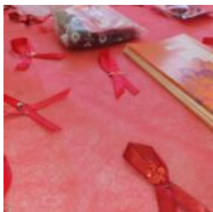
Olinda faz ações alusivas ao Dezembro Vermelho - Foto: Sandro Barros / PMO