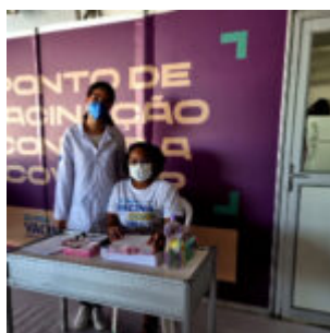
Olinda oferta vacinação contra Covid-19 na 30ª Fenearte