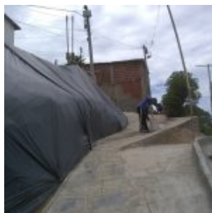
Defesa Civil concentra trabalho em vistorias de edificações, quedas de árvores e reposição de lonas