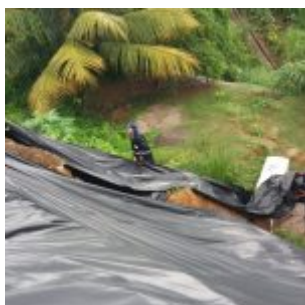
Defesa Civil concentra trabalho em vistorias de edificações, quedas de árvores e reposição de lonas

Em caso de emergência e orientações durante as chuvas, os moradores dos morros podem acionar a Defesa Civil de Olinda pelos telefones: 0800.281.2112 / 3429-0838 e (081) 99266-5307 (Whatsapp). Veja abaixo, imagens realizadas na madrugada e na manhã de hoje (24).