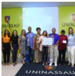
Profissionais da categoria destacam a valorização da gestão municipal com os profissionais.