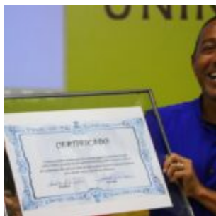
Profissionais da categoria destacam a valorização da gestão municipal com os profissionais.