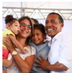
400 Famílias foram contempladas