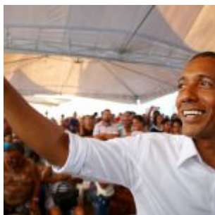
400 Famílias foram contempladas