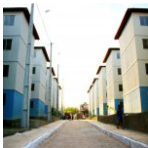
400 Famílias foram contempladas