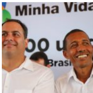
400 Famílias foram contempladas