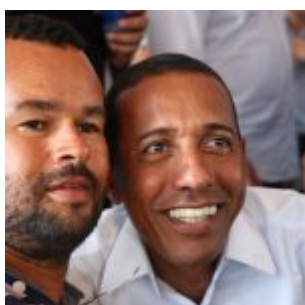
400 Famílias foram contempladas