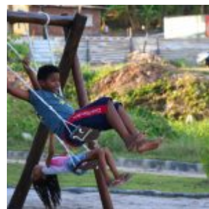
400 Famílias foram contempladas