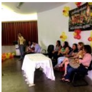
Formatura de 200 alunos da Escola Allan Kardec (Salgadinho).