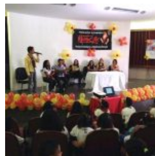
Formatura de 200 alunos da Escola Allan Kardec (Salgadinho).