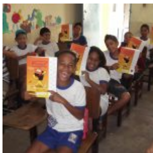
Programa sendo posto em prática na sala de aula.