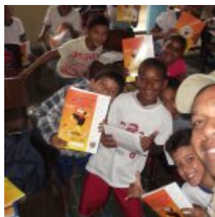
Programa sendo posto em prática na sala de aula.