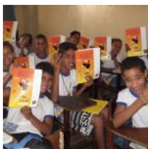
Programa sendo posto em prática na sala de aula.