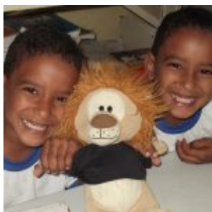
Programa sendo posto em prática na sala de aula.