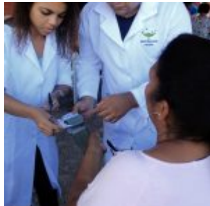
Olinda em Ação no bairro de Jardim Brasil.