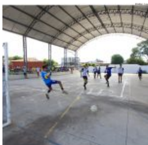
Ato pela paz nos estádios, marca o Olinda em Ação, no bairro de Jardim