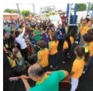
Ato pela paz nos estádios, marca o Olinda em Ação, no bairro de Jardim Brasil.