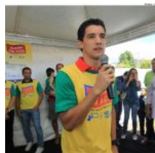
Ato pela paz nos estádios, marca o Olinda em Ação, no