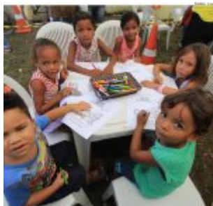
Olinda em Ação no bairro de Jardim Brasil.