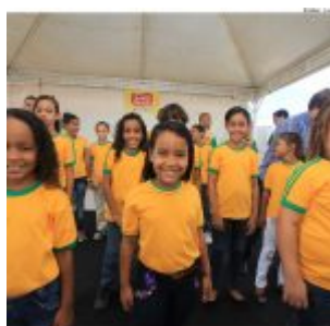
Ato pela paz nos estádios, marca o Olinda em Ação, no bairro de Jardim Brasil.