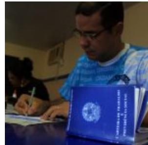
Olinda em Ação no bairro de Jardim Brasil.