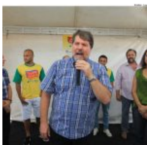
Ato pela paz nos estádios, marca o Olinda em Ação, no bairro de Jardim Brasil.

acontecem não só no Brasil como em outras partes do mundo, de racismo, tão deplorável, tão condenável, que nós temos que vencer. Nessa edição especial do Olinda em Ação damos um abraço no (estádio municipal) Olindão, pela paz nos estádios. Estamos juntos contra toda e qualquer violência, assim como contra todas as manifestações de racismo”, destacou o prefeito Renildo Calheiros.