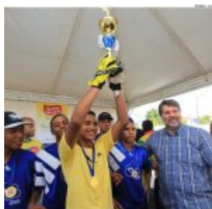
Ato pela paz nos estádios, marca o Olinda em Ação, no