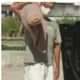
Tecido para confeção de máscaras