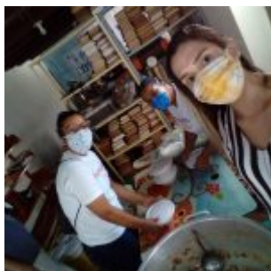
Voluntários do Projeto Olinda Solidária