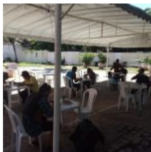
Beneficiários do projeto

Outra iniciativa solidária desenvolvida na cidade é o Humaniza Olinda. Foi criado a partir da comunhão entre instituições públicas municipais, empresas privadas e sociedade civil organizada que trabalham para diminuir os impactos causados pela pandemia com pessoas em situação de rua. Voluntários arrecadam alimentos para preparo de marmitas que, de forma itinerante, levam refeições para diversos bairros da periferia de Olinda.