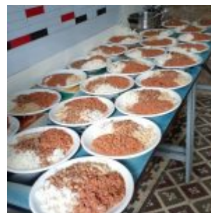
Distribuição de almoços