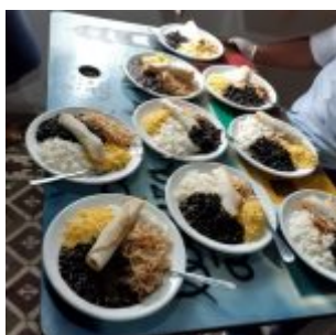
Distribuição de almoços