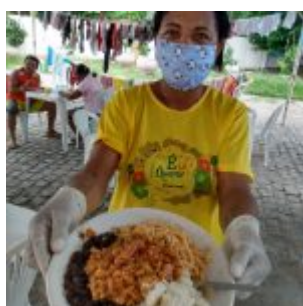
Distribuição de almoços