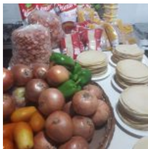
Preparação das refeições