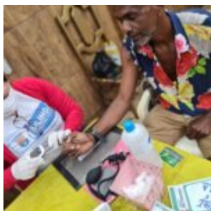
Ilê Asé Kiobambo Ósún Yaomintalade recebe ação do Saúde nos Terreiros