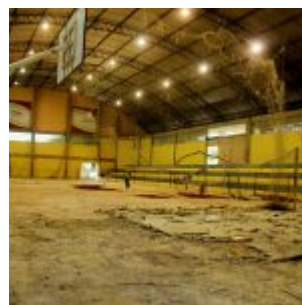
Reforma na Vila Olímpica de Rio Doce.