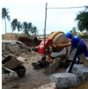
Reforma na Vila Olímpica de Rio Doce.