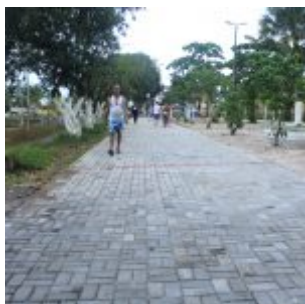
Reforma na Vila Olímpica de Rio Doce.