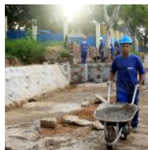
Reforma na Vila Olímpica de Rio Doce.