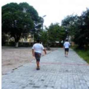
Reforma na Vila Olímpica de Rio Doce.