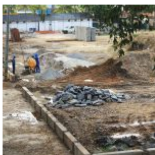
Reforma na Vila Olímpica de Rio Doce.