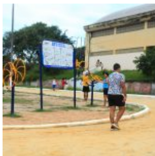
Reforma na Vila Olímpica de Rio Doce.