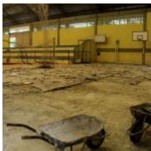
Reforma na Vila Olímpica de Rio Doce.