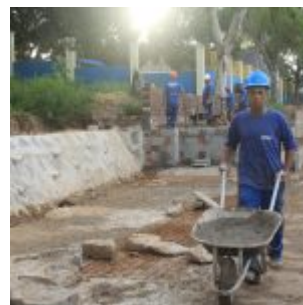
Reforma na Vila Olímpica de Rio Doce.