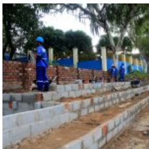
Reforma na Vila Olímpica de Rio Doce.