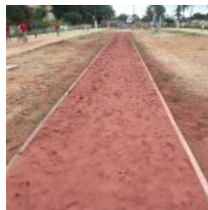
Reforma na Vila Olímpica de Rio Doce.